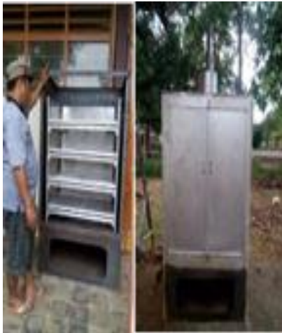
Tipe OFC – 40H