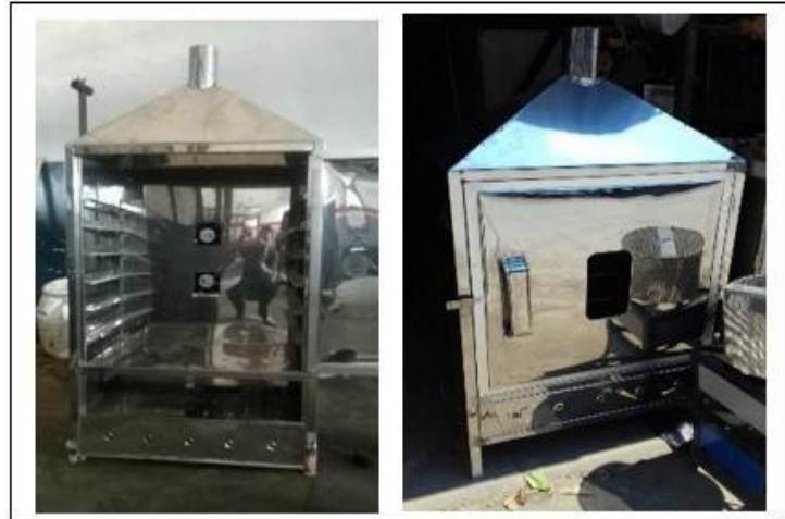
Tipe Lemari Perokok