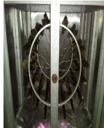
Tipe Cakalang Grilled R3 Polnam