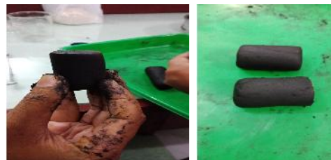
Gambar 1. Briket kulit durian

Briket yang dihasilkan pada penelitian adalah jenis silinder. Bentuk briket dapat dilihat pada Gambar 1. Briket yang berbentuk silinder kebanyakan digunakan untuk kalangan industri kecil dan menengah. Data hasil pengamatan dapat dilihat pada Tabel 1. Standar mutu dan karakteristik pembuatan briket untuk rumah tangga di Indonesia dapat dilihat pada Tabel 2.