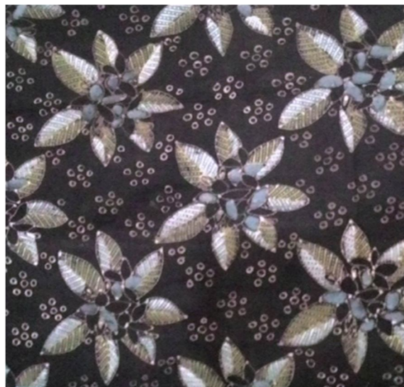
Gambar 4. Motif Jepun Ageng