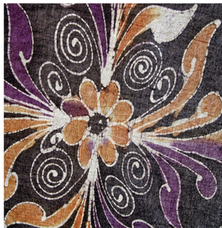
Gambar 2. Motif batik Bali.

Bali sebagai daerah tujuan wisata yang lengkap dan terpadu memiliki banyak sekali tempat wisata yang menarik untuk dikunjungi. Tempat-tempat wisata yang banyak dikunjungi di Bali: Pantai Kuta, Pura Tanah Lot, Pantai Padang-Padang, Danau Beratan Bedugul, Garuda Wisnu Kencana, Pantai Lovina, Pura Besakih, Uluwatu, Ubud, Munduk, Kintamani, Amed, Denpasar Art Center , Tulamben, Pulau Menjangan dan masih banyak yang lainnya (Tempat Wisata di Bali Terfavorit, 2014). Sentra kerajinan batik di Bali juga berkembang menjadi tempat tujuan wisata, antara lain di Desa Tohpati yang terletak sekitar 10 menit dari perjalanan pusat kota Denpasar. Daerah ini terkenal sebagai pusat dari kerajinan batik di Bali. Di tempat ini juga terdapat paket pelatihan pembuatan batik secara lengkap mulai dari desain sampai dengan proses pembuatan menjadi kain batik. Paket wisata pelatihan batik ini banyak menarik minat wisatawan asing untuk belajar membuat kain batik. (Desa Tohpati, 2012). Di Gianyar juga terdapat sentra batik, tepatnya di Banjar Tegehe, Desa Batubulan, Kecamatan. Sukawati (Batik Galuh Gianyar, 2014).