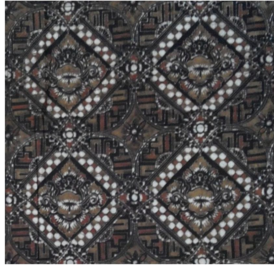
Gambar 6. Motif Teratai Banji

keseimbangan antara baik dan buruk (Putra, 2014).