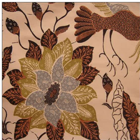
Gambar 1. Motif batik Bali bahan sarung.