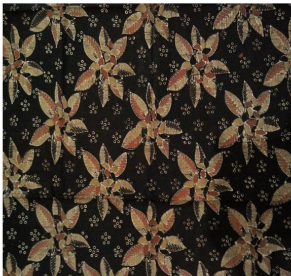
Gambar 3. Motif Jepun Alit